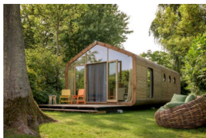
Impressie mogelijk tijdelijke en verplaatsbare Tiny House op tuinen