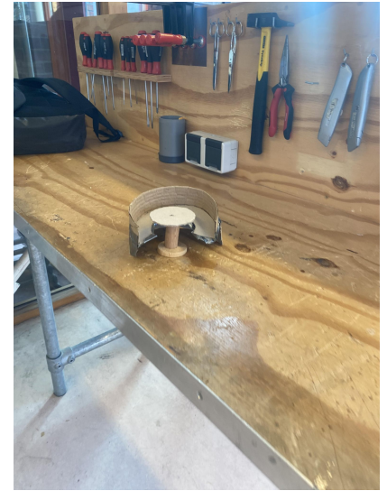
Het bankje + tafel