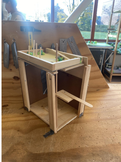
Het hondenpark op dak